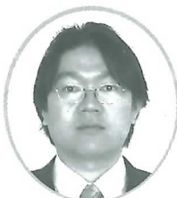
建部医師 (芹香病院)

本年4月以降、精神医療センターに 来られた医療スタッフを紹介します。 いずれの者もセンターの基本理念を 踏まえ、皆さんに信頼される心あたた かい医療を提供するよう努力します ので、よろしくお願ひいたします。