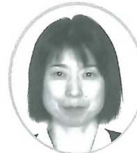
井口病棟 看護科長 (芹香病院)