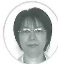
及川病棟 看護科長 (芹香病院)